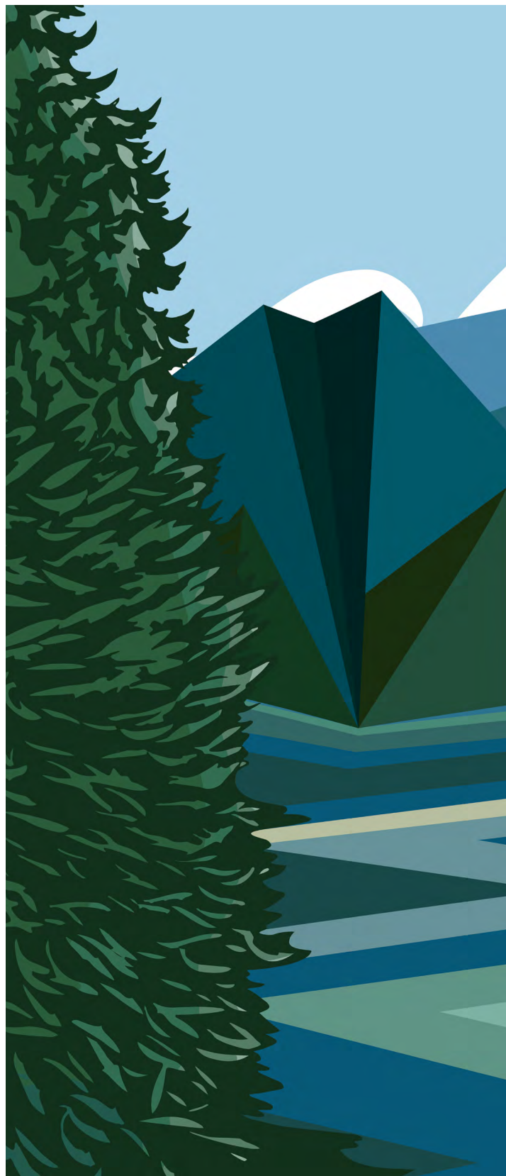
Artista: Carrielynn Victor