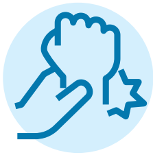
Bong gân và căng cơ

Bác sĩ gia đình hoặc điều dưỡng cao cấp của bạn biết rõ nhất về nhu cầu chăm sóc sức khỏe của bạn, nhưng nếu bạn không thể gặp họ, hãy đến một trung tâm UPCC (Urgent and Primary Care Centre) để được chăm sóc khẩn cấp trong cùng ngày cho các vấn đề sức khỏe không đe dọa đến tính mạng.