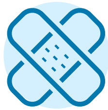
Vết cắt, vết thương hoặc bệnh trạng về da