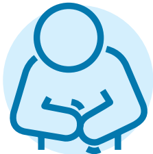
Buồn nôn, tiêu chảy và táo bón