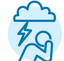
Các vấn đề về sức khỏe tâm thần như tâm trạng chán nản, lo lắng hoặc trầm cảm