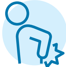
Cơn đau mới hoặc trầm trọng hơn