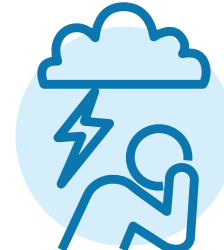
ਮਾਨਸਿਕ ਸਿਹਤ ਸੰਬੰਧੀ ਚਿੰਤਾਵਾਂ ਜਿਵੇਂ ਕਿ ਮੂਡ ਖਰਾਬ ਹੋਣਾ, ਐਂਗਜ਼ਾਇਟੀ (ਬੇਚੈਨੀ ਜਾਂ ਚਿੰਤਾ) ਜਾਂ ਡਿਪਰੈਸ਼ਨ (ਉਦਾਸੀ)